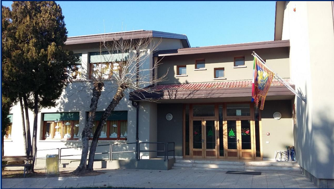
“DANTE ALIGHIERI” Vic. Giovanni XXIII San Giorgio in Bosco (PD) tel.049/9450882