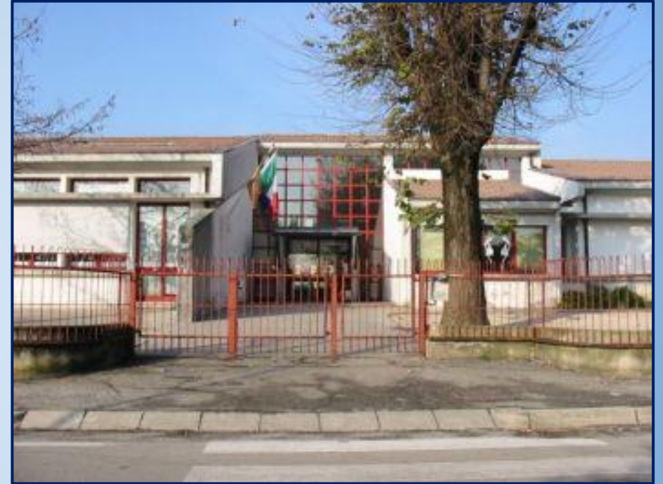
“LEONARDO DA VINCI” Via Ramusa,71 Paviola (Pd) tel 049/5996748